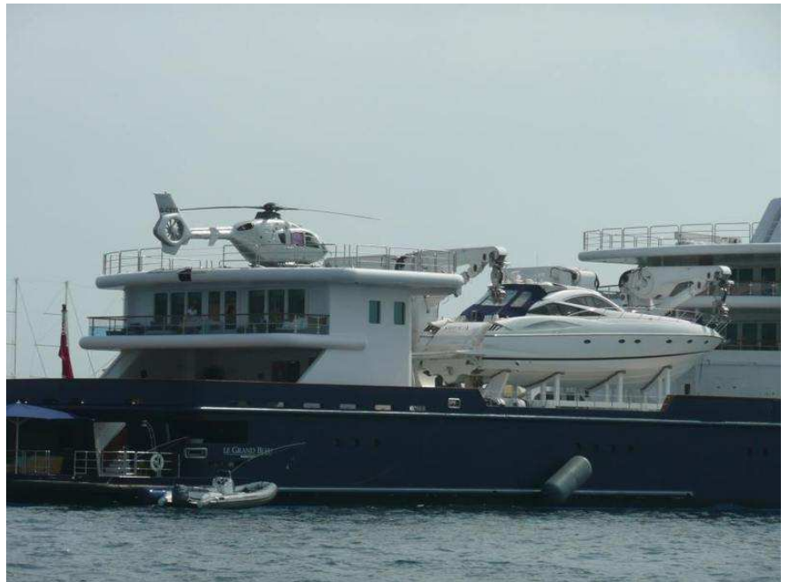
Die Steuerbordseite mit dem Luxusbeiboot der Marke Guy Cuoach...

Leider hält sich Abramowitsch in Bezug auf sein Privatleben recht bedeckt, sodass es auch keine Fotos oder nähere Informationen über das Innenleben seiner Yachten gibt. Also müssen wir uns mit einer kleinen „Rundfahrt“ begnügen: